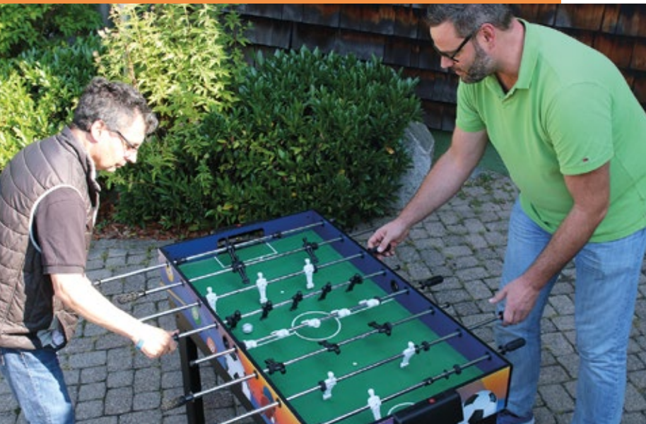
Vollen Einsatz zeigen Gäste und Mitarbeiter beim Kickerturnier

Seit 1994 in den Räumen des Begegnungszentrums Laubenhof beheimatet, bietet die Tagespflege heute 20 Plätze an. Zu uns kommen sowohl Menschen mit altersbedingten Einschränkungen als auch solche, die sich Zusammenhalt, Gemeinschaft und ein buntes Programm wünschen.